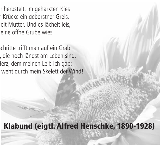
Klabund (eigtl. Alfred Henschke, 1890-1928)